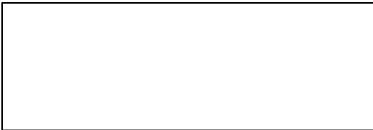
Схема участка пробоотбора